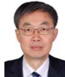
吕建(1960—),男,博士,教授,博士生导师,CCF 会士,主要研究领域为软件方法学.