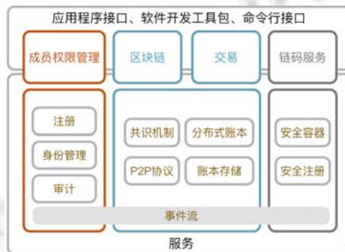
Fig.2 The architecture of Hyperledger

在以上基础服务之上,Hyperledger 还提供了应用程序接口(API)、软件开发工具包(SDK)、命令行接口(CLI),方便了开发人员的开发工作.