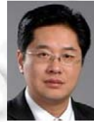
管海兵(1971—),男,博士,教授,博士生导师,CCF 杰出会员,主要研究领域为云计算.