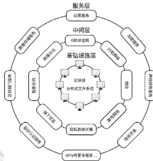
Fig.4 The architecture of BaaS 图4 区块链即服务架构图

我们设计了区块链即服务的通用3层架构模型(如图4所示):第1层是基础设施层,负责数据存储、检索、修改、删除,封装了数据存储的底层细节,对外提供统一的应用程序编程接口(API);第2层是中间层,在基础设施之上,扩展了更多协议,使用区块链和分布式文件系统基础架构实现各项点到点的直接通信协议,并且实现了区块链与区块链外界交互信息的相关协议等,进一步拓展了区块链的使用场景;第3层是服务层,封装以上所有功能,结合用户需求,抽象出用户需要的相关服务,并提供相应接口支持未来可扩展性,简化用户的开发工作.