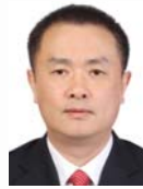
梅宏(1963-),男,博士,教授,博士生导师,中国科学院院士,CCF 高级会员,主要研究领域为软件工程,软件复用,软件构件技术,分布对象技术.