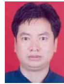
张师超(1962—),男,博士,教授,博士生导师,主要研究领域为数据挖掘,机器学习.