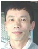
严小卫(1961—),男,博士,教授,博士生导师,主要研究领域为人工智能,数据挖掘.