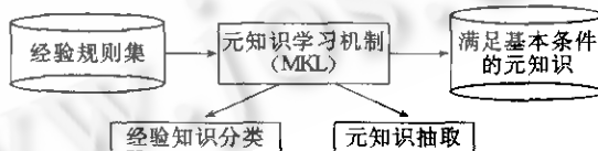
图1 元知识学习机制

知识获取系统 NDKAS [3] 提供了元知识学习机制,可以自动地从知识库中抽取需要的元知识. 在 NDKAS 系统中,元知识是以二叉树形式来表示的. 二叉树的中间节点构成元知识层,其叶节点是一些彼此密切相关的经验知识组成的子知识库. NDKAS 系统的元知识学习机制,由经验知识分类和元知识抽取两部分组成,如图 1 所示.