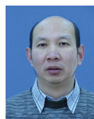
李宣东(1963—), 男, 博士, 教授, CCF 会士, 主要研究领域为软件工程, 系统软件, 可信软件, 形式化方法.