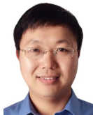
彭鑫(1979—), 男, 博士, 教授, 博士生导师, CCF 杰出会员, 主要研究领域为软件智能化开发与运维, 人机物融合泛在计算, 智能网联汽车.