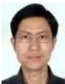
张迎周(1978-), 男, 博士, 教授, CCF 高级会员, 主要研究领域为软件工程, 程序分析.