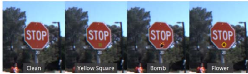
Fig.1 A stop sign and its backdoored versions using, from left to right, a sticker with a yellow square, a bomb and a flower as backdoors [21]