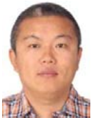
李国良(1981—),男,博士,教授,博士生导师,CCF 杰出会员,主要研究领域为数据库,大数据分析和挖掘,群体计算.