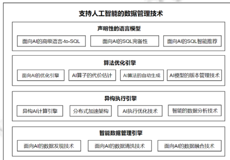
Fig.2 Database management techniques for artificial intelligence

最后,我们对未来基于数据库的人工智能优化技术的发展方向加以展望(见第 5 节).