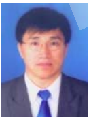
李建中(1950—),男,博士,教授,博士生导师,CCF 高级会员,主要研究领域为数据库系统实现技术,数据仓库,半结构化数据,传感器网络,压缩数据库技术,Web 数据集成,数据挖掘,计算生物学.