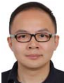
黄宇(1982-),男,博士,教授,博士生导师,CCF 专业会员,主要研究领域为分布式算法,分布式系统,网络化软件系统.