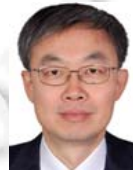
吕建(1960-),男,博士,教授,博士生导师,CCF 会士,主要研究领域为软件方法学.