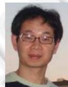
陈胜勇(1973—),男,博士,教授,博士生导师,CCF 高级会员,主要研究领域为计算机视觉.