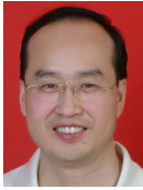
王尚平(1963—),男,陕西扶风人,博士,教授,博士生导师,主要研究领域为密码理论,网络安全.