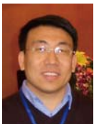
刘挺(1972—),男,博士,教授,博士生导师, CCF 高级会员,主要研究领域为自然语言处理,信息检索.