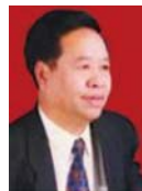
李生(1943—),男,博士,教授,博士生导师, CCF 会员,主要研究领域为自然语言处理,信息检索,机器翻译.