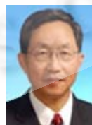
孙家广(1946—),男,教授,博士生导师,主要研究领域为 CAD,软件工程,数据库.