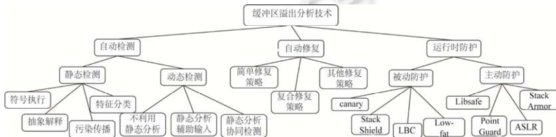
Fig.2 Overview of buffer overflow analysis technologies classification

针对上述问题,本文有如下两个观点:(1) 因为造成严重后果的缓冲区溢出漏洞通常是攻击者通过外部输入来获得系统控制权限的,因此污染传播这种针对外部输入数据的传播路径进行跟踪的技术在静态检测缓冲区溢出漏洞这一领域扮演重要的角色,该技术与符号执行或抽象解释(比如区间分析)紧密结合或许可以更准确地检测缓冲区溢出漏洞;(2) 近年来,符号执行、抽象解释、污染传播等传统静态检测技术发展得较为成熟,或许科研人员可以转换思路,暂时不致力于研究提高传统静态技术本身,而是将新兴技术融入传统静态检测技术,比如将机器学习算法用于特征分类,辅助传统静态检测技术,可能会进一步提高缓冲区溢出漏洞静态检测的精度和效率.