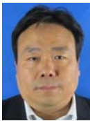
贺毅朝(1969—),男,河北晋州人,教授,CCF高级会员,主要研究领域为演化计算,组合优化算法,近似算法,群测试理论.