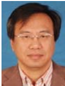
王熙照(1963—),男,博士,教授,博士生导师,主要研究领域为机器学习,进化计算,大数据分析.