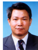
史忠植(1941—),男,研究员,博士生导师,CCF 会士,主要研究领域为人工智能.