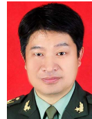
韩文报(1963—),男,博士,教授,博士生导师,主要研究领域为信息安全,网络密码.