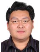
毕军(1972-),男,博士,教授,博士生导师,CCF 高级会员,主要研究领域为计算机网络体系结构,网络安全,协议工程学.