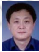
吴建平(1953-),男,博士,教授,博士生导师,CCF 高级会员,主要研究领域为计算机网络体系结构,网络协议工程学,下一代互联网.