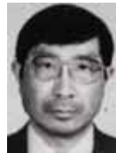
龚正虎(1945 - ),男,教授,博士生导师,主要研究领域为路由与交换技术,网络管理,网络测量.