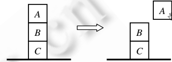
Fig.2 Transition of state S_i in BWDP