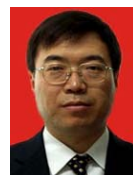
马建峰(1963—),男,博士,教授,博士生导师,CCF 高级会员,主要研究领域为计算机安全,密码学,移动和无线网络的安全.