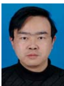
冯涛(1970—),男,甘肃临洮人,博士,研究员,主要研究领域为安全协议复合理论,无线传感器网络安全.