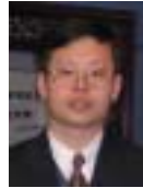
汪东升(1966 - ),男,博士,教授,博士生导师,CCF 高级会员,主要研究领域为高性能计算,计算机系统结构.