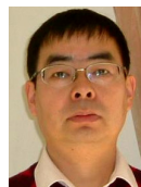
郁文生(1964—),男,博士,教授,博士生导师,主要研究领域为符号计算和实代数,系统全局优化,数学机械化与推理自动化及其在信息领域的应用.