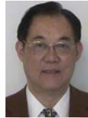
王国俊(1935—),男,教授,博士生导师,CCF 高级会员,主要研究领域为不确定性推理,计量逻辑学.