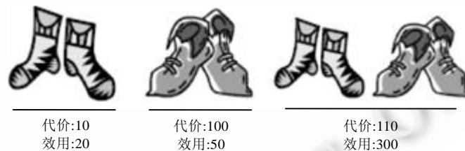
Fig.1 Example for goal utility dependencies

规划问题的目标之间往往存在着许多内在联系.例如在图 1 所示的穿鞋袜任务中,只穿一双袜子获得的效益值为 20,只穿一双鞋子获得的效益值为 50,但是同时穿一双鞋子和一双袜子会大大增加舒适感,因而给予极高的效益值 300.可见在实际问题中,目标之间往往不是相互独立的,目标集的效益值不能简单地表示成单个目标效益的和.为了显式地表示这些隐含的关系,Do 等人 [3,4] 提出使用 GAI(goal additive independence)模型来描述目标效益依赖(goal utility dependencies)关系,即目标集的效益值等于它所包含的多个目标子集的效益函数之和.Russell 等人 [5] 提出使用 UCP-net 模型来表示目标之间的效益依赖,即树结点的两个分支分别对应实现和不实现某目标的效益值.虽然这些描述方式,特别是 GAI 模型具有直观和易用等优点,但都不是标准规划领域描述语言(planning domain description language,简称 PDDL)的特性,因而不能在一般的 OSP 规划系统上进行推广和使用.