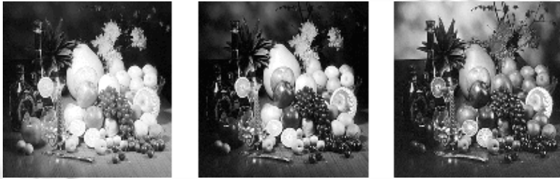
Fig.2 From left to right are gray images of picture Fruit composed by three-color components r, g, b respectively 图 2 从左到右分别是彩色水果图 Fruit 的 r, g, b 颜色分量组成的灰度图像

在将图像中每个像素的三色分量 r, g, b 各自单独抽取出来作为灰度图像在该点的灰度值的观察中,我们发现它们在结构上具有非常相似的地方,有差别的只是在不同的地方,其亮度有所不同(如图 2 所示).也就是说,当我们用分形方法进行图像编码时,如果有一个分量的 R 块和 D 块相似,那么另外两个分量的相同位置的 R 块和 D 块也非常相似,只是在亮度上有差别.